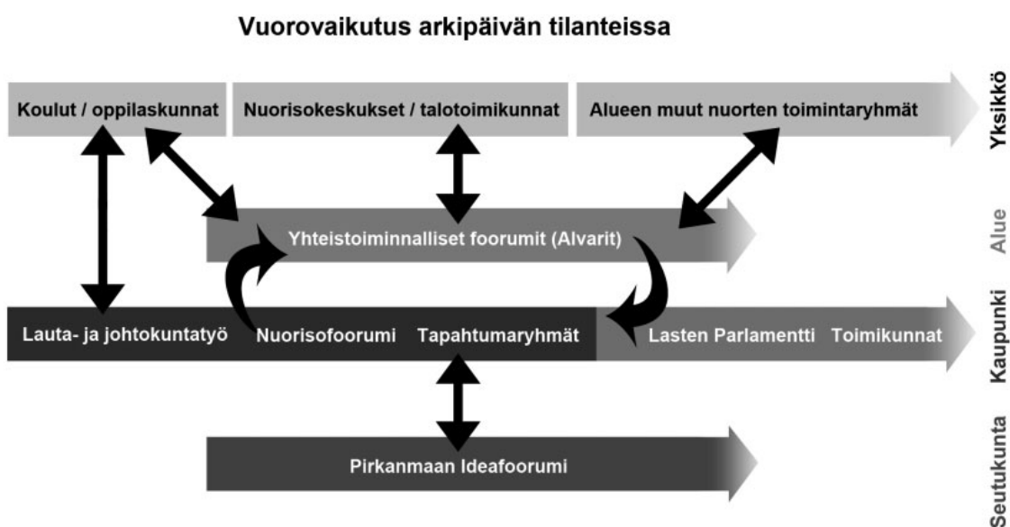
Kuvio 2. Osallistumisen tasot Tampereella

Kaupungissa on kehitetty erillisiä rakenteita lasten ja nuorten osallisuudelle, mm. oppilaskunnat, alueellinen vaikuttaminen, Lasten Parlamentti ja Nuorisofoorumi. Jo luotuja osallisuuden rakenteita kehitetään edelleen. Tampere kaupunki arvostaa lapsia ja nuoria oman elämänsä asiantuntijoina. Tamperealaisella osallisuustoiminnalla toivotaan saavutettavan asenteita, jotka mahdollistavat ja kannustavat lasten ja nuorten kasvun aktiiviseen kansalaisuuteen niin että osallisuus on osa kaikkien tamperealaisten lasten ja nuorten arkea.